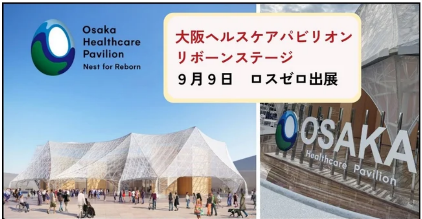
大阪ヘルスケアパビリオン「リボーンステージ」

株式会社ロスゼロ（大阪市）は9/9、大阪ヘルスケアパビリオンにて「捨てるか、資源か。大量生産・消費・廃棄時代は終わり、次の資源として活用することで、豊かな地球を創る」とのテーマで登壇・出展いたします。